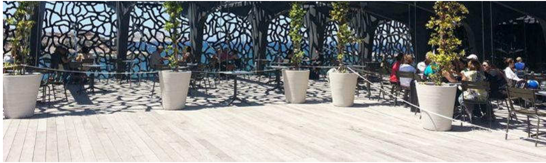
Terrasse sur le toit du Mucem. Le musée veut être à la fois un lieu culturel et un lieu de vie.